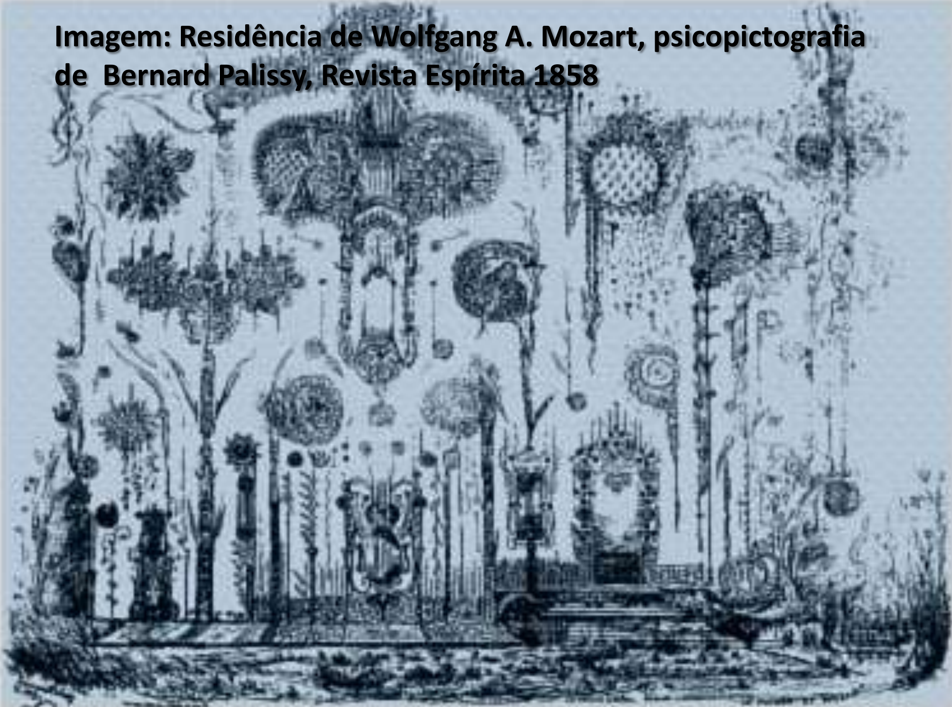
Imagem: Residência de Wolfgang A. Mozart, psicopictografia de Bernard Palissy, Revista Espírita 1858