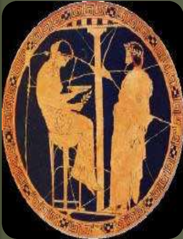
Imagem: fragmento de encenação do Oráculo em Delfos, Grécia

FORMA DE TRANSIÇÃO PARA O CULTO INDIVIDUAL DOS ESPÍRITOS, QUE POR SUA VEZ EXIGIRÁ A INDIVIDUALIZAÇÃO MEDIÚNICA (PITONISA DE ENDOR E SAUL)