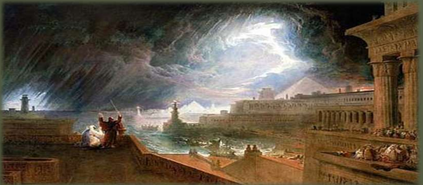
Moisés e o Mar vermelho

TRANSIÇÃO DO MEDIUNISMO COLETIVO (GRANDES IDEALIZAÇÕES COLETIVAS) PARA O MEDIUNISMO INDIVIDUAL (INTERPRETAÇÕES PESSOAIS DA FENOMENOLOGIA)