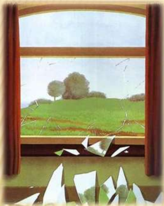
Imagem: La clef des Champs (A Chave dos Campos), René Magritte

O HOMEM QUE SE MANTÉM FECHADO NO CÍRCULO DO HORIZONTE CIVILIZADO, APEGANDO-SE AOS “BENS DE CIVILIZAÇÃO”, NÃO ABRE OS OLHOS E A MENTE PARA AS PERSPECTIVAS MAIS AMPLAS DO HORIZONTE ESPIRITUAL.