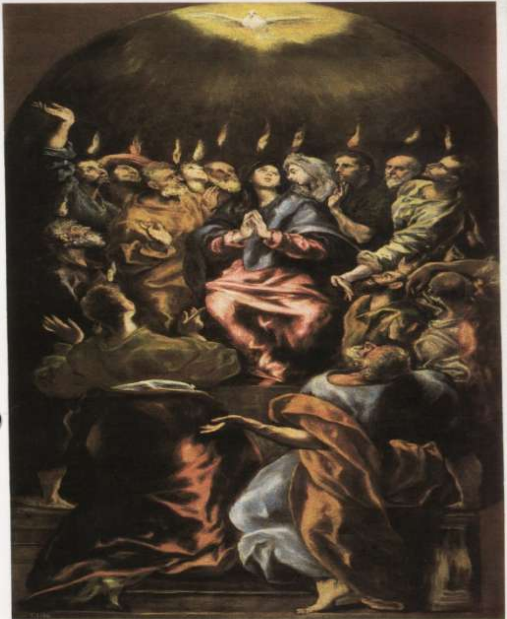
A Descida do Espírito Santo: El Greco (1541-1614).

A RELIGIÃO TORNA-SE ESPIRITUAL; A MEDIUNIDADE TOMA NOVOS CONTORNOS, CONDUZINDO OS PRÓPRIOS APÓSTOLOS DE JESUS A 'DESVESTIREM' A CÁPSULA AGRÁRIA PARA ENTRAR NO NOVO MUNDO DA TRANSCENDÊNCIA ESPIRITUAL.