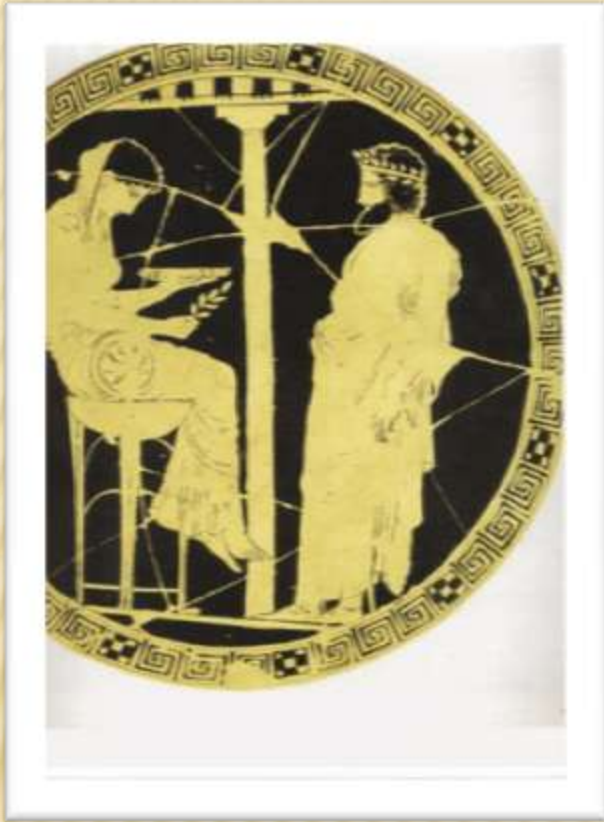
Imagem: fragmento de encenação no Oráculo em Delfos, Grécia.

OS MÉDIUNS ANTIGOS ADQUIREM UMA NOVA QUALIDADE : NÃO SERIAM MAIS SUBMISSOS A E SPÍRITOS DOMINADORES, SEM DOMÍNIO DO PRÓPRIO TRANSE, MAS INTÉRPRETES DE UM DEUS UNIVERSAL, SUPREMO, RACIONAL (Abraão);